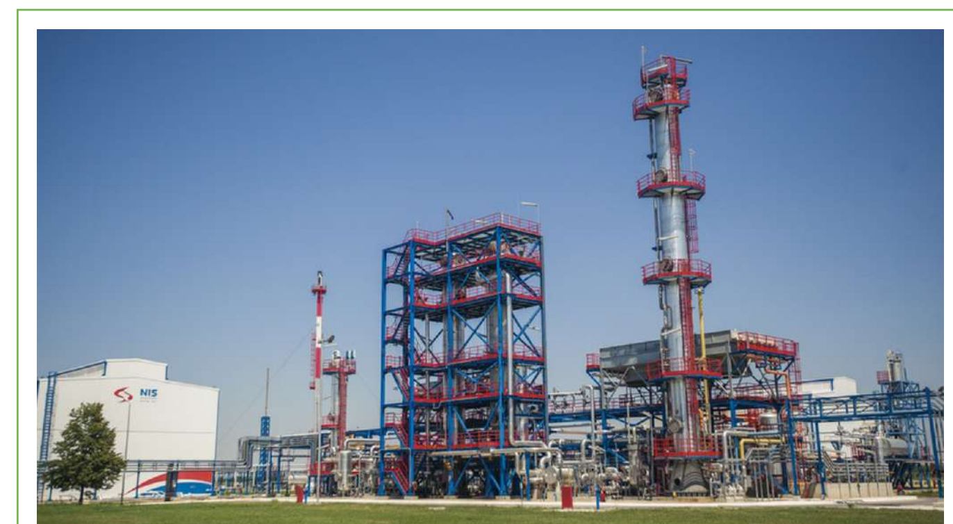
HiPACT® プラント (ナフトナ・インダストリア・サービジェ (NIS) 社、セルビア国)

HiPACT® has high stability against thermal degradation. It enables an increase in CO 2 stripping pressure and a reduction in CO 2 compression costs in CCUS. Further, superior CO 2 absorption performance enables a reduction in CO 2 recovery costs. JGC has a commercial natural gas plant experience.