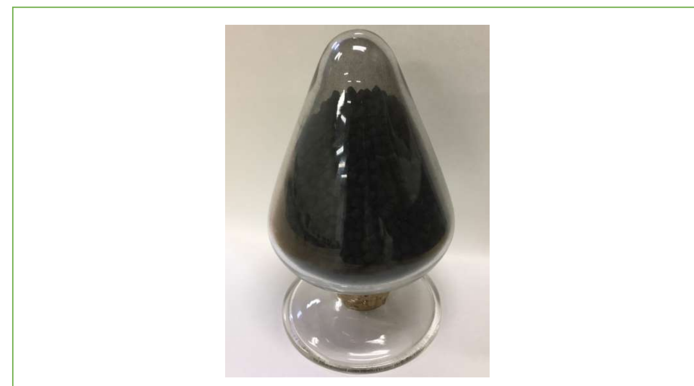
図2 当社製メタン化触媒 Fig.2 methanation catalyst