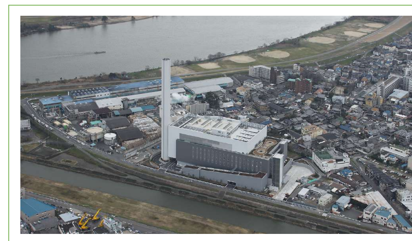
図3 日本/大阪広域環境施設組合 東淀工場 竣工:2010年 処理能力:400t/日(200t/日×2炉) 発電能力:10MW