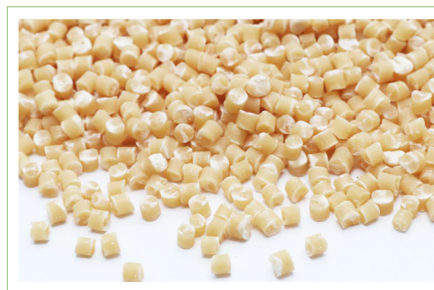
図1 ライスレジン (米含有率 70%) Fig.1 Rice Resin

Rice Resin does not require a large-scale plant, can be produced in small quantities according to specifications at low cost.