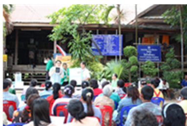
保険商品説明会の様子（タイ）

タイにおける保険募集は、SOMPOタイランドが、タイ農業協同組合銀行（BAAC）のローン利用者向けに BAAC を通じて行っており、販売地域を当初のタイ東北部1県のみから、現在はタイ東北部全域（20 県）まで拡大させている。2014年には、ミャンマーのほかフィリピンでも『天候インデックス保険』を開発した。更に、現在では、インドネシアでも商品開発プロジェクトが進行中である。