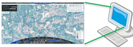
リアルタイムシミュレーション

2015 年 11 月から 2016 年 3 月まで、タイ北部ウッタラディット県において、本システムを活用した浸水区域を予測する実証実験を実施。タイの国家災害警報センター（NDWC）にとって、防災 ICT における初の日・タイ協力プロジェクトであり、総務省から受託した「タイにおける洪水シミュレータの展開に向けた調査研究」の一環として、在タイ日本国大使館とも協力しながら実施した。