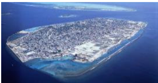
工事初期段階のマレ島の鳥瞰図

モルディブの首都マレ島は地盤が平坦で、平均海抜が約 1.5m と低いため、高潮の被害が続発していた。特に 1987 年と 1988 年の異常高潮では、既設の海岸護岸施設や家屋に 600 万ドル規模の被害があり、首都機能が麻痺。また、地球温暖化による海面上昇問題で水没の危機にも見舞われている。日本政府は無償資金協力により護岸建設を支援。大成建設は、1987 年マレ島南岸の消波堤工事に着手し、その後マレ島周囲約 6 km にわたり堅固な護岸の整備を実施した。モルディブでは、建設資材の多くを輸入に頼らざるを得ないため、コンクリート骨材を含めマレーシア、シンガポールなど近隣諸国から運搬し、工事用水や作業員の生活用水には海水脱塩装置により塩分を除去した海水を利用した。自然への悪影響を極力回避するため、コーラルストーン（珊瑚石）の採掘は行わないなどの配慮も行った。その結果、2004 年 12 月のスマトラ沖大地震ではマレ島の人的被害はゼロで、物的損害も大幅に軽減され、人命と首都機能の保全に大きな成果をもたらした。