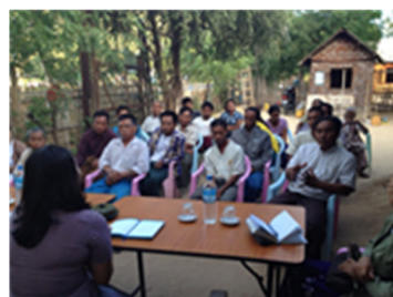
ヒアリングサーベイの様子（ミャンマー）