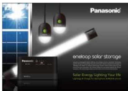
ソーラーストレージ

気候変動に伴う災害増加による住民の生活環境への影響が懸念されるミャンマー、インド、ケニア、エチオピア等でソーラーランタン及びソーラーストレージを、現地代理店を通して販売する。インドネシアでは、在インドネシア日本大使館の草の根無償協力のもと、既に「パワーサプライコンテナ」を離島の学校に設置し、子供たちの学びの場を支援している。非常用電源の提供により、夜間や停電時における、教育機会の提供、防犯、マラリア発生率の高い熱帯地域においては迅速な検査や治療を可能とする。