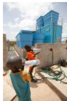
安全な水を飲む子供たち（セネガル）