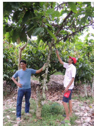
カカオの成長の様子