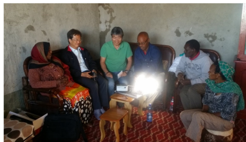
住民の生活にもたらされた明かり（エチオピア）