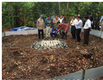
現地関係者への説明