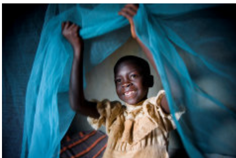
「オリセット®ネット」で喜ぶ子供

気候変動の影響により蚊の繁殖エリアが拡大し、蚊が媒体する感染症の増加が懸念される地域において、「オリセット®ネット」を販売。タンザニアのA to Z社に製造技術が無償供与し、2003年9月には現地生産を開始した。さらに拡大する需要に対応するため、A to Z社とJVで「オリセット®ネット」生産会社を設立。この事業を通じて最大7000人の現地雇用を生み出すなど、地域経済の発展にも貢献している。2010年には、アジアの生産拠点と合わせて年間最大6000万張の生産体制を構築。現在、世界基金（The Global Fund）、国連児童基金（UNICEF）などの国際機関を通じて80か国以上の国々に提供されている。さらに、2011年以降はケニアやアジア諸国のスーパーマーケットを通じて、一般消費者向けの販売を開始し、多様な販売チャネルの開拓にも注力している。